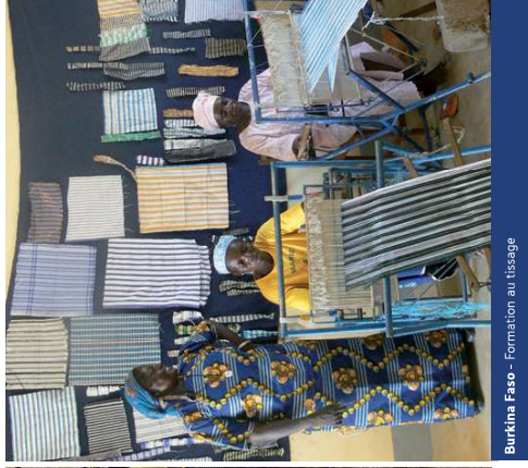
Burkina Faso - Formation au tissage