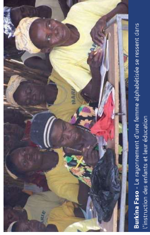
Burkina Faso - Le rassemblement d'une femme alphabétisée se ressent dans l'instruction des enfants et leur éducation