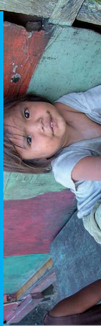
Philippines - Un regard qui en dit long

Le programme enfants des rues compte 12 centres qui accueillent 220 enfants qui survivaient de mendicité, de vol ou de prostitution. Ces centres sont la première étape pour réapprendre à vivre en société avant une vie plus stable dans des foyers de vie et l'entrée à l'école. Le centre des jeunes filles porte le nom de Raoul et Madeleine Follereau. En 2014, un foyer a ouvert pour accueillir les enfants de 0 à 6 ans de plus en plus nombreux dans les rues.