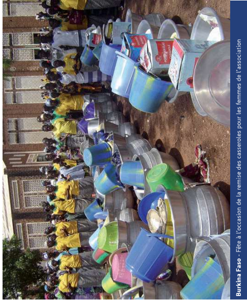
Burkina Faso - Fête à l'occasion de la remise des casseroles pour les femmes de l'association